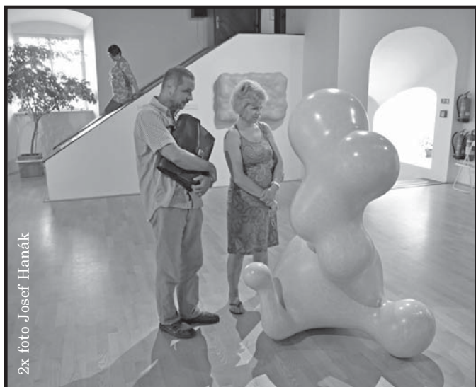
2x foto Josef Hanák