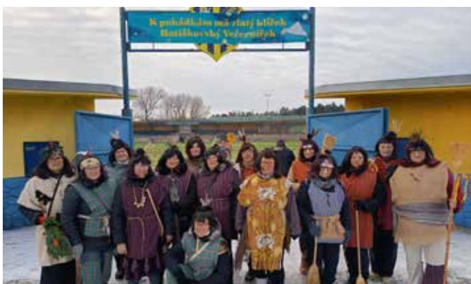
Malé čarodějnice před hlavní bránou