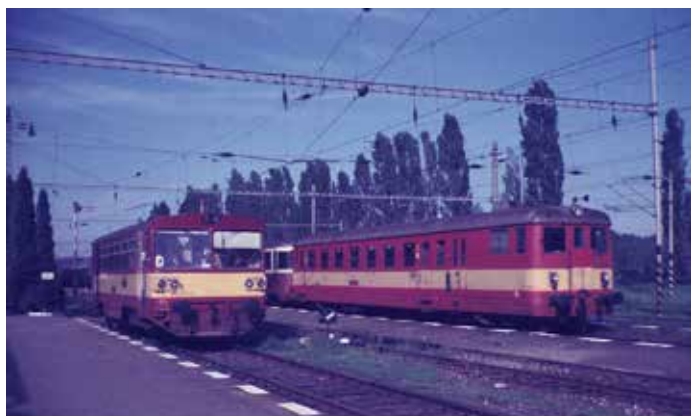
Osobní vlaky do Sudoměřic jezdily od vedlejšího nástupiště. V květnu 1991 tam stál motorový vůz od tzv. sudoměřské kače, čekající na přípoj od Přerova.