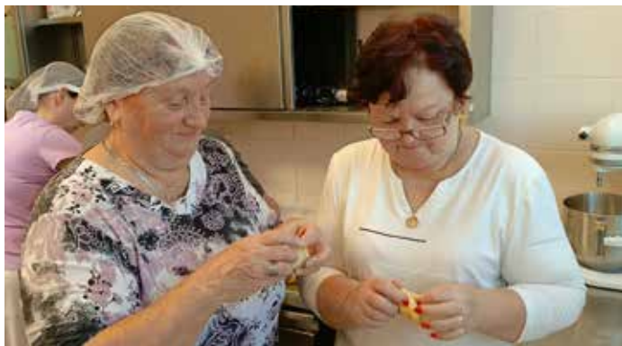
Koláčky na Silvestra