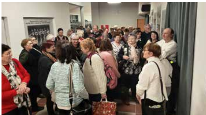
VIP zóna před koncertem DRUPI