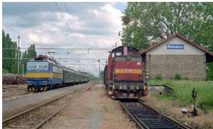
Motorová lokomotiva postává u nákladkové rampy a skladištní budovy, opodál osobní vlak do Břeclavi. Rohatec, červen 1995.