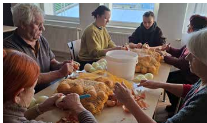
Loupání cibule na Silvestra