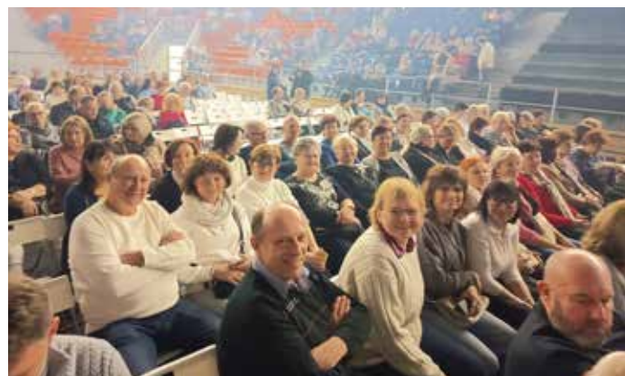
Před koncertem DRUPI