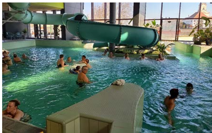
Termální koupaliště Győr Maďarsko