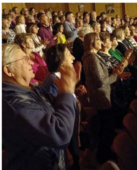
Koncert Karel Svoboda