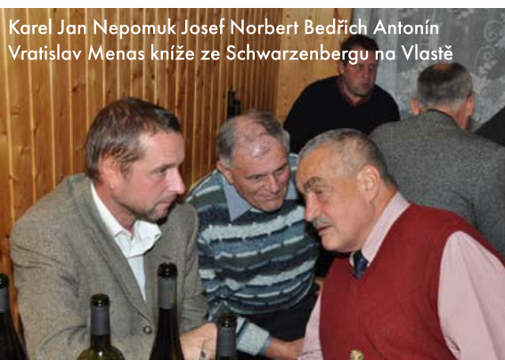
Karel Jan Nepomuk Josef Norbert Bedřich Antonín Vratislav Menas kníže ze Schwarzenbergu na Vlastě