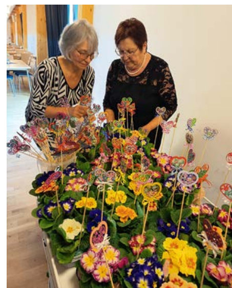
Příprava květin pro ženy